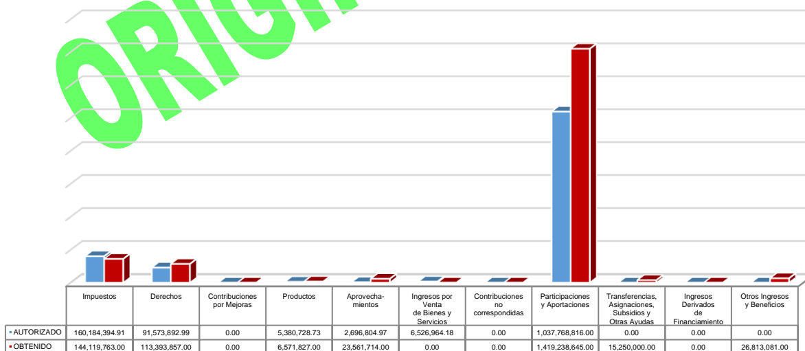
Gráfico 4. Ingresos